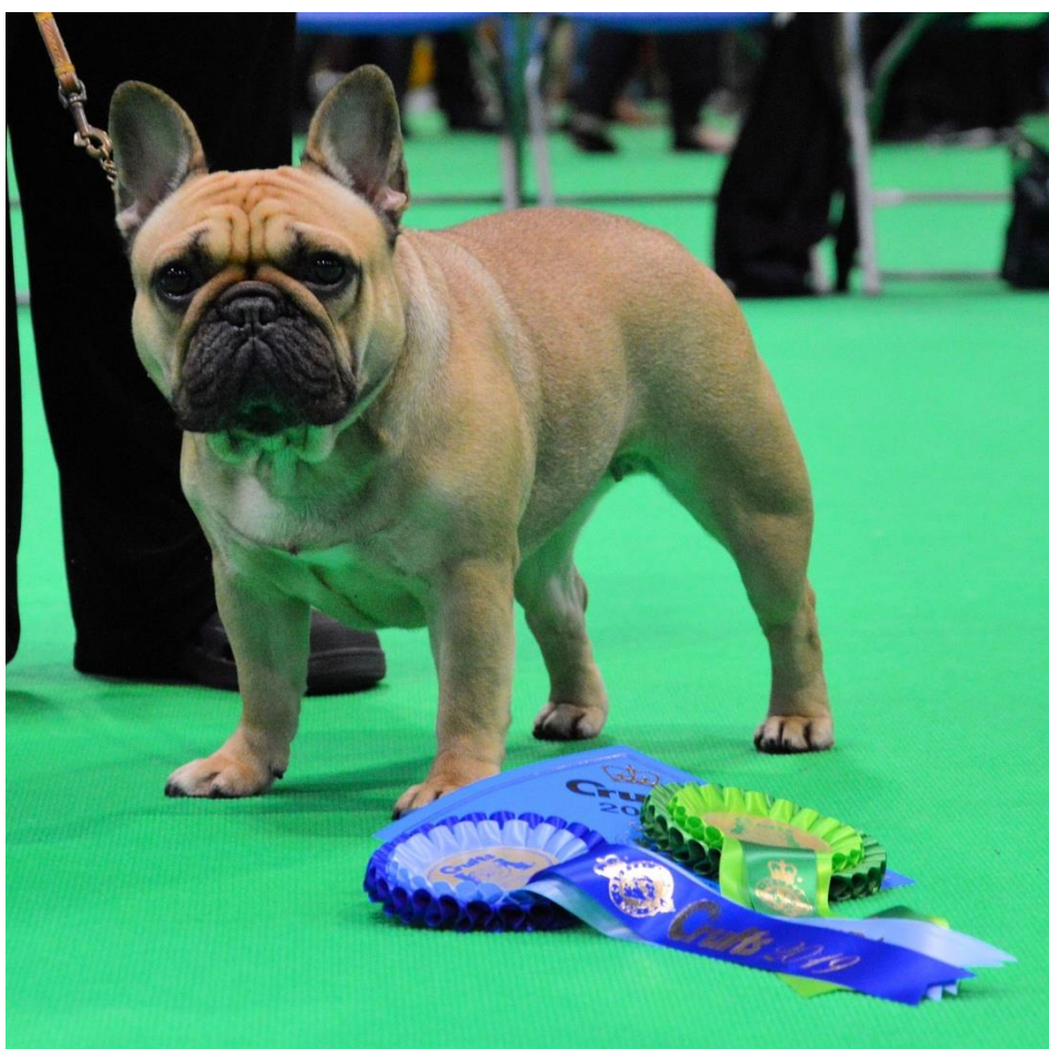
Dit artikel werd ingeleverd door Fred en Els de Bie